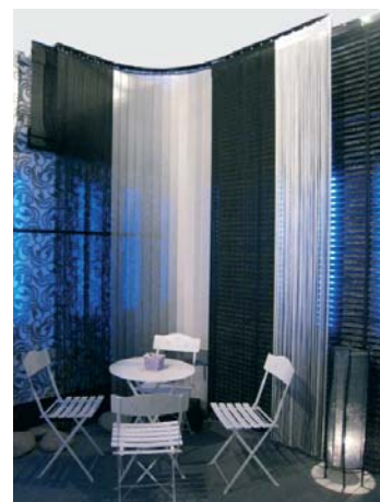
Гнутые карнизы для вертикальных жалюзи