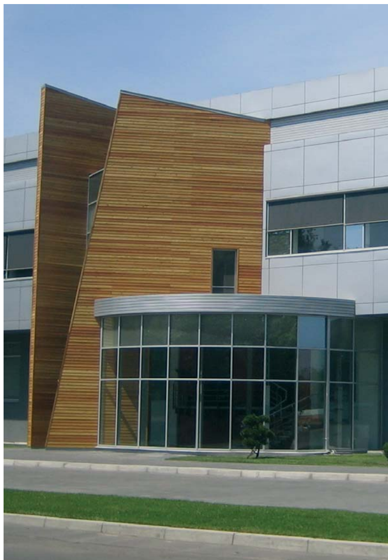
Система Reflexol. Офисно-производственное здание фирмы Манеж

Сегодня время архитекторов и дизайнеров новой формации — творческих и креативных, готовых осуществлять самые смелые решения и проекты, благодаря которым изменяется облик наших городов, офисов и квартир. Смелые архитектурные решения влекут за собой новшества в отрасли дизайна.